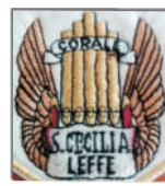
Corale Santa Cecilia

Questo Gruppo, fondato nel 1928 (appartente all'ANA che è un'associazione d'arma che opera anche nel volontariato, senza fini di lucro) ha sede a LEFFE nella "Baita" in Via Ré. Si prefigge la realizzazione della vita associativa nelle sue varie manifestazioni e nello specifico, oltre a partecipare a quanto organizzato dal Nazionale e dalla Sezione, collabora con l'Amministrazione Comunale in varie occasioni e in varie attività e con Enti e associazioni d'Arma e non, presenti nel territorio. Altro obiettivo certamente altrettanto importante, è mantenere alto lo spirito di Corpo, il ricordo degli Alpini Caduti e di quelli "andati avanti". Tutto questo grazie agli Alpini e agli Amici iscritti e ai collaboratori, sempre nello spirito del volontariato e a titolo completamente gratuito.