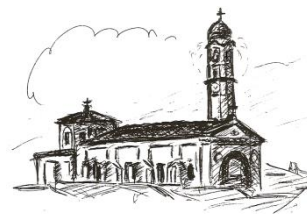
Parrocchia di San Michele Arcangelo