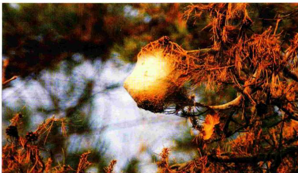
Nido di Thaumetopoea pityocampa.

In entrambi i casi lo scopo sarà quello di realizzare un ambiente sfavorevole ed inidoneo alla vita della processionaria durante il suo ciclo di sviluppo.