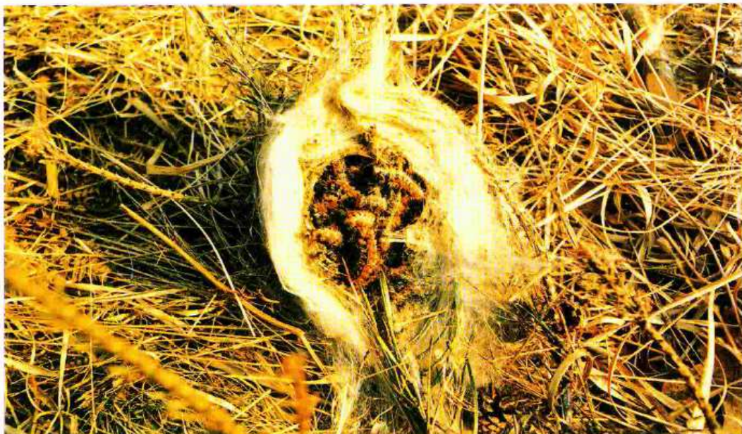
Nido aperto colmo di larve di processionaria del pino.

La processionaria è un insetto appartenente all'ordine dei Lepidotteri, le comuni farfalle. Durante gli stadi larvali (bruchi) le processionarie sono fitofaghe; si alimentano cioè delle parti verdi delle piante, provocando defogliazioni, indebolimento e blocco dell'accrescimento. Il riconosciuto potere molesto delle larve è dovuto alla presenza su di esse di numerosissimi peli urticanti che possono causare irritazioni e allergie cutanee all'uomo. Le popolazioni di processionaria sono soggette ad ampie fluttazioni cicliche, per cui si succedono periodi con sporadiche e modeste apparizioni a periodi con massicce infestazioni. Ciò avviene ogni 8 - 10 anni. Ci sono due specie di processionaria nella nostra penisola: la processionaria del pino ( Thaumetopoea pityocampa ) e la processionaria della quercia ( Thaumetopoea processionea ). Queste hanno un ciclo biologico diverso e in conseguenza di ciò i trattamenti, che devono essere effettuati sulle larve giovani, cadono per la processionaria del pino in agosto - settembre e per la processionaria della quercia in marzo - aprile.