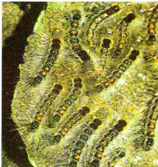
Giovani larve di E. Chrysorrhoea

Danni: le larve nascono e divengono attive nel pieno dell'estate, dalla fine di luglio alla metà di agosto. Hanno colore bruno nerastro, sono dotate di setole biancobruno (dalle proprietà urticanti) e sul dorso sono provviste di tubercoli color arancio. Ai lati del corpo si notano delle striature longitudinali bianco - arancio. Le larve manifestano tendenze gregarie. Le foglie delle piante ospiti (quercia, tiglio, acero, pioppo, carpino, rosacee e fruttifere varie) vengono ridotte alla sola nervatura. L'attacco determina dunque diffuse defogliazioni delle specie vegetali attaccate, che subiscono indebolimento e predisposizione ad altre malattie. Le modalità di lotta sono analoghe a quelle per Hyphantria Cunea .