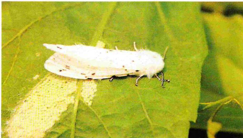
Adulto femmina di Hyphantria C. durante l'ovodeposizione.

I bruchi, raggiunta la maturità (in un mese circa) si mettono alla ricerca di adatti ricoveri: nel terreno, in un anfratto di tronco d'albero, in crepe nei muri, sotto le tegole delle abitazioni, per incrisalidarsi e svernare (larve della II generazione).