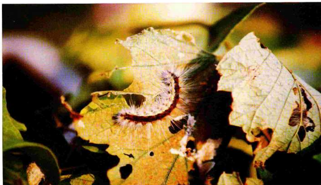
Larva di Hyphantria Cunea

Al centro - sud o nelle isole, si potrebbe anche giungere a tre generazioni l'anno.