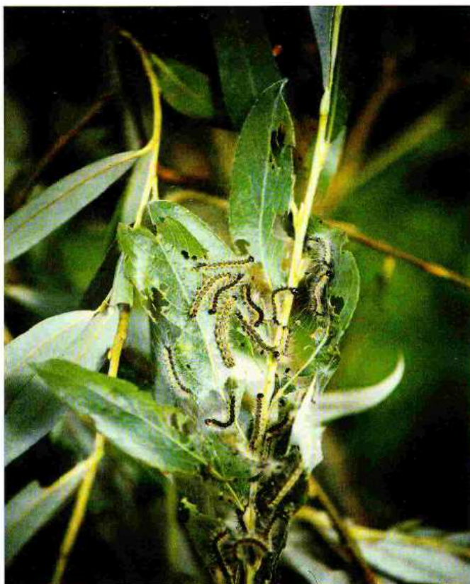
Larve di Hyphantria Cunea

le larve, estremamente polifaghe, provocano defogliazioni a carico di numerose specie, prediligono il gelso e l'acero negundo (che sono i primi ad essere attaccati). Noce, pioppo, platano, salice, tiglio, sambuco sono frequentemente colpiti e, nel caso di gravi infestazioni, anche ippocastano ed olmo, diverse specie di frutteti e di arbusti ornamentali possono essere danneggiati. Danni occasionali e solitamente contenuti si possono inoltre verificare sul finire dell'estate, a carico di coltivi di erba medica, mais e soia, attigui ad alberate intensamente defogliate.