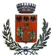
Comune di Gandino