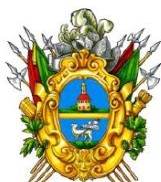
Comune di Casnigo